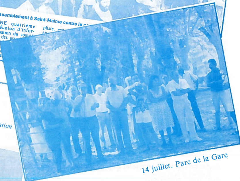
14 juillet. Parc de la Gare

ges au cœur, de la nature. Notre photo St-Maime, près de Géosol