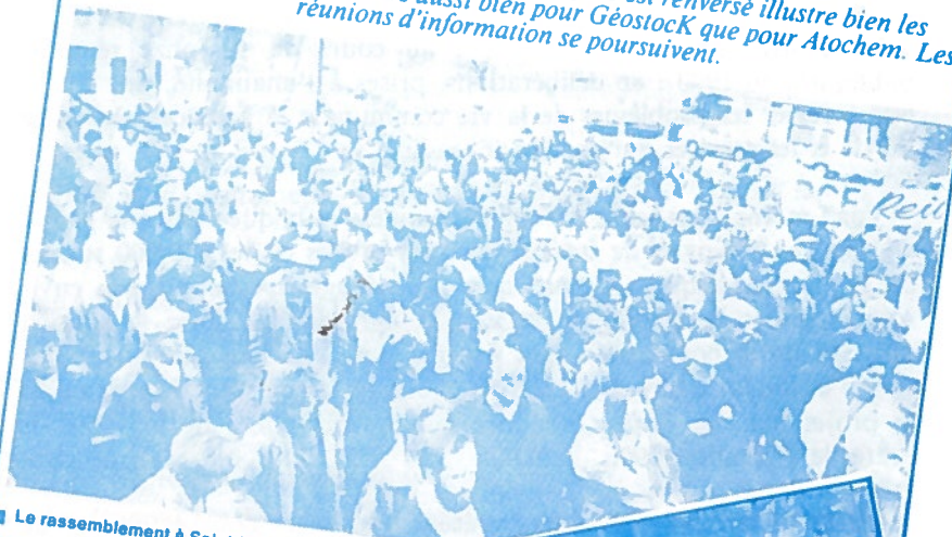
Le rassemblement à Saint-Maime contre le...

Le camion citerne transportant de l'acide qui s'est renversé illustre bien les dangers des transports routiers aussi bien pour Géostock que pour Atochem. Les réunions d'information se poursuivent.