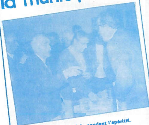
Le maire et des personnalités pendant l'apéritif.

Le samedi 12 janvier, le maire de Saint-Maime a présenté ses vœux à la population. Vœux qui étaient attristés par l'imminence d'une déclaration de guerre dans le Proche-Orient.