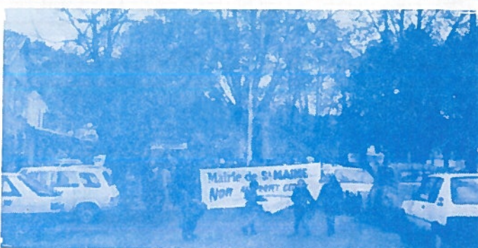
Manifestation contre le projet Géofix