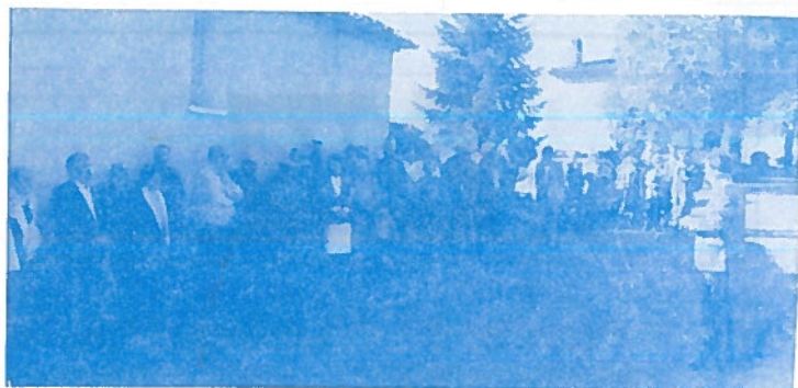
Allocution au Monument aux Morts